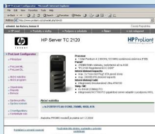
Web interface ve standardu HP

Multijazyčný systém obsahuje celkem 5 modulů a jeho serverová část využívá platformu Linux. Systém pracuje v prostředí Intranetu a Internetu a je nasazen na trhu v České republice a Slovinsku. Rozšíření do dalších zemí se připravuje.